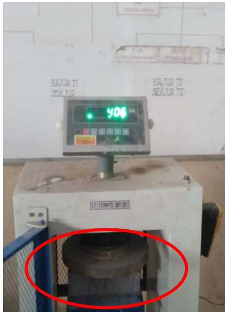
Gambar 1. Uji kuat tekan paving

Setelah benda uji paving mencapai umur 28 hari maka selanjutnya dilakukan uji kuat tekan paving dengan menggunakan alat compression test . Paving diletakan hirisontal pada alat uji dan dilakukan uji tekan sampai didapatkan nilai tekan maksimal dari masing-masing benda uji seperti terlihat pada Gambar 1. Hasil pengujian kuat tekan paving tiap variasi dapat dilihat pada Tabel 2.