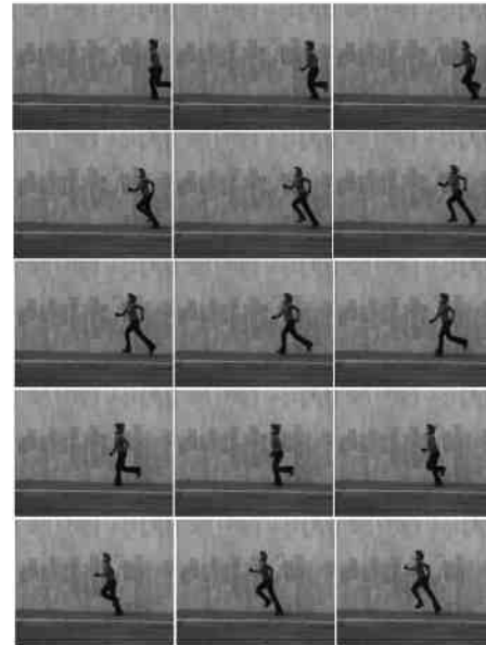
Gambar 2. Data set dari video dirubah menjadi Jpeg

Pengambilan data awal dilakukan dengan cara mengubah format avi menjadi format jpeg dimana hasil gambar akan digunakan dalam proses selanjutnya. Formula Matematika