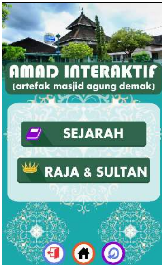
Gambar 10. Tampilan menu SEJARAH AMAD

Gambar 10 merupakan subhalaman menu Sejarah, yang berisi antarmuka tombol Sejarah dan Raja & Sultan. Menu pencatuman subhalaman ini dimaksudkan agar pembaca bisa memilih mana yang ingin dipelajari terlebih dahulu. Adanya dua tombol di sini juga sebagai sarana untuk menuju ke tampilan yang lebih detail tentang Masjid Agung Demak baik sejarah berdirinya maupun para pihak yang pernah memimpin Demak.