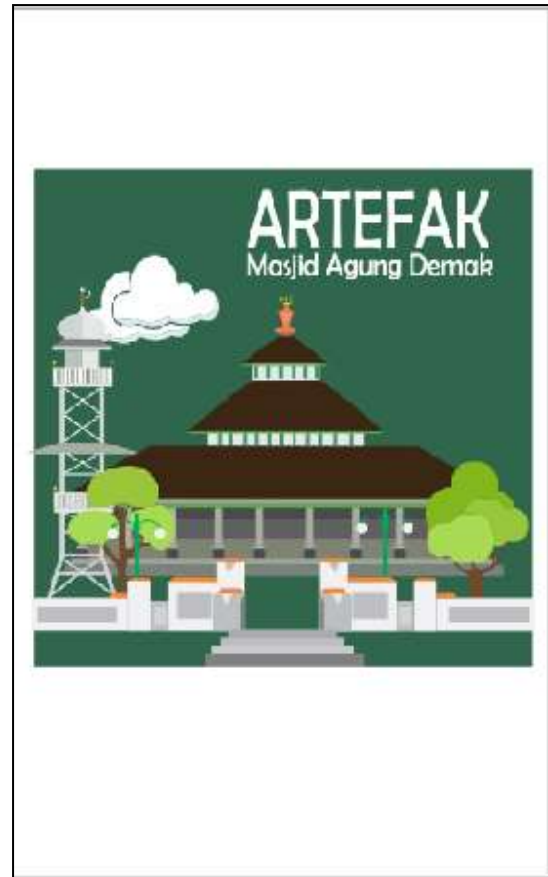
Gambar 8. Tampilan awal/splashscreen pembuka AMAD

Hasil sketsa pada subbab di atas menjadi acuan untuk perancangan prototype AMAD. Prototype ini dirancang menggunakan perangkat lunak Adobe Flash CS6 yang mendukung perangkat smartphone . Pemrograman menggunakan action script as3 yang mendukung publish di perangkat sistem operasi android. Secara keseluruhan, terdapat 8 (delapan) tampilan visualisasi utama yang dimulai dari tampilan pertama hingga tampilan informasi aplikasi. Delapan tampilan tersebut memiliki sub-sub halaman sesuai dengan menu utama yang diakses. Setiap sub halaman memiliki tampilan gambar sebagai informasi utama dan teks sebagai informasi pendukung. Berikut delapan tampilan utama dalam prototype AMAD interaktif.