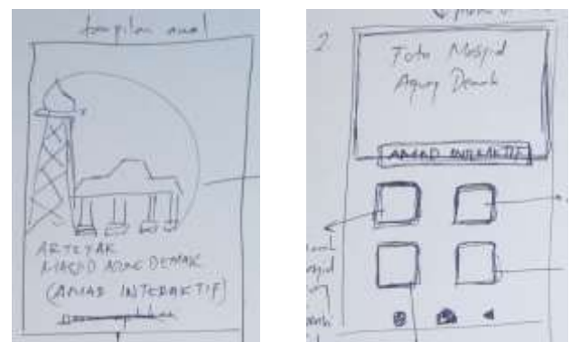
Gambar 4. (a) Tampilan awal aplikasi interaktif; (b) tampilan menu utama

Tahap prototype dalam design thinking akan dijelaskan secara rinci dalam subbab ini. Tahap awal yaitu sketsa konsep prototype aplikasi interaktif, yang diberi nama AMAD (Aplikasi Masjid Agung Demak). berikut sketsa-rancangan prototype aplikasi interaktif.