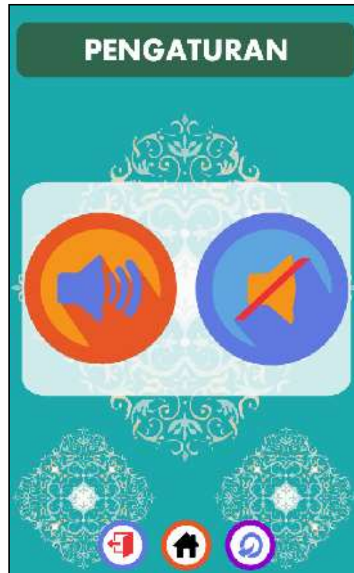
Gambar 14. Tampilan PENGATURAN

yang menjelaskan nama dan informasi tentang artefak tersebut. Halaman ini bisa digeser untuk menampilkan artefak-artefak lain. Artefak yang ditampilkan merupakan artefak yang diobservasi oleh peneliti di museum Masjid Agung Demak dan sekitarnya. Informasi detail tentang artefak bersumber dari naskah foto atau hasil studi literatur.