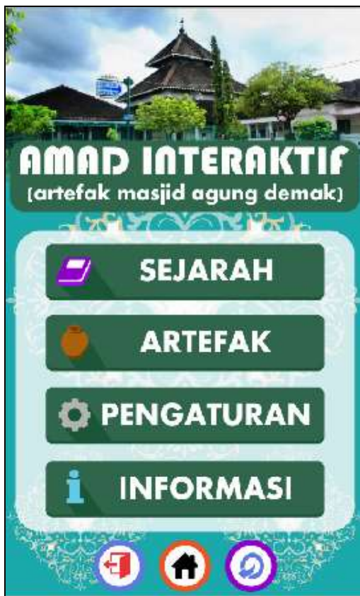
Gambar 9. Tampilan menu utama AMAD