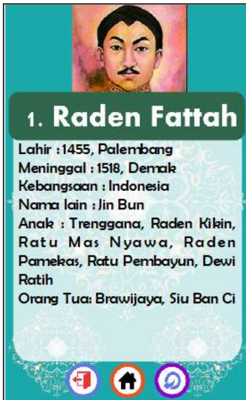
Gambar 12. Tampilan menu RAJA & SULTAN AMAD