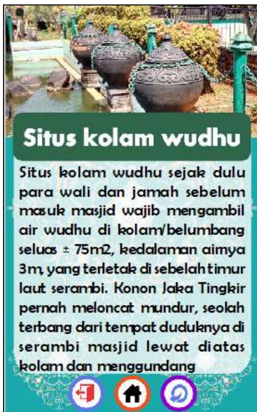
Gambar 13. Tampilan ARTEFAK

Gambar 13 merupakan tampilan dari menu ARTEFAK. Pada halaman ini disajikan gambar artefak beserta teks