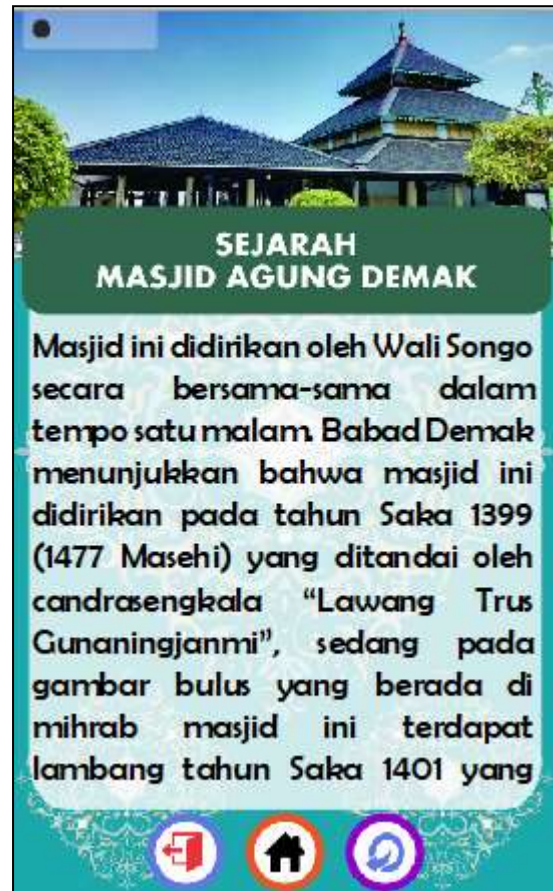
Gambar 11. Tampilan Submenu Sejarah Masjid Agung Demak

Gambar 10 merupakan subhalaman menu Sejarah, yang berisi antarmuka tombol Sejarah dan Raja & Sultan. Menu pencatuman subhalaman ini dimaksudkan agar pembaca bisa memilih mana yang ingin dipelajari terlebih dahulu. Adanya dua tombol di sini juga sebagai sarana untuk menuju ke tampilan yang lebih detail tentang Masjid Agung Demak baik sejarah berdirinya maupun para pihak yang pernah memimpin Demak.