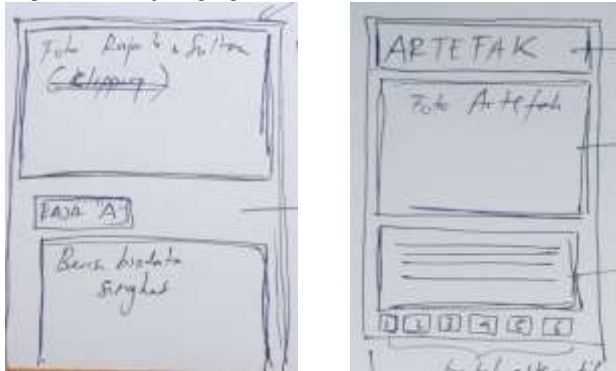
Gambar 6. (a)Tampilan foto raja dan sultan Demak; (b) tampilan artefak-artefak masjid Agung Demak