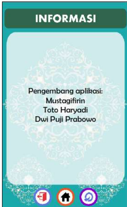
14. Tampilan INFORMASI