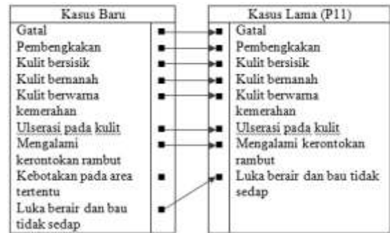
Gambar 3. Ilustrasi Konsultasi Penyakit Kulit Anjing

Perhitungan nilai kemiripan dilakukan dengan membandingkan gejala - gejala yang terdapat pada konsultasi dibandingkan dengan gejala-gejala yang terdapat pada kasus lama dalam hal ini penyakit dengan kode penyakit = P11. Perhitungan nilai kemiripan menggunakan algoritma K-Nearest Neighbour . Berikut ini hasil perhitungan berdasarkan gambar 3 :