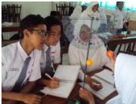
Gambar 2. Kerja ilmiah peserta didik

Penelitian ini adalah penelitian berbasis praktikum di laboratorium fisika, peserta didik melakukan praktikum tumbukan untuk menentukan besar koefisien restitusi tumbukan dari 2 bola mainan yang digantung dengan seutas tali pada statip, data sudut penyimpangan sebelum dan sesudah tumbukan kemudian dikonversi kedalam besaran kecepatan dari konsep hukum kekekalan energi mekanik, olah data menggunakan bantuan microsoft excel, bola maian; bola tek-tek, bola pingpong, bola bekel karet bening, busur, statip. Praktikum dilakukan secara berkelompok terdiri dari 8 kelompok tiap kelompok 4 siswa pada kelas X IPA1 SMA Negeri 2 Kebumen semester 2 tahun pelajaran 2017/2018. seperti pada gambar 2 di bawah ini