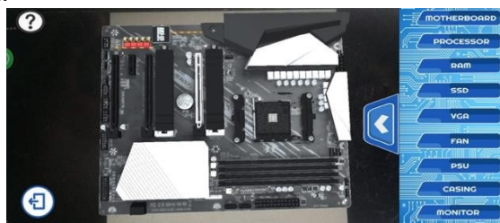
Gambar 2. Tampilan Mulai

Pada tampilan menu mulai/menu utama disini akan menyediakan beberapa komponen seperti tombol tanda tanya tombol keluar dan tombol untuk menampilkan beberapa pilihan jika kita pencet tanda tanya pada tampilan maka akan ada penjelasan komponen pada komputer dan jika kita pencet icon speaker maka akan keluar suara berupa penjelasan komponen tersebut. Jika kita pencet beberapa komponen pada button pada sisi kanan maka isinya ada motherboard, processor, ram, ssd, vga, fan, psu, casing, monitor, dll.