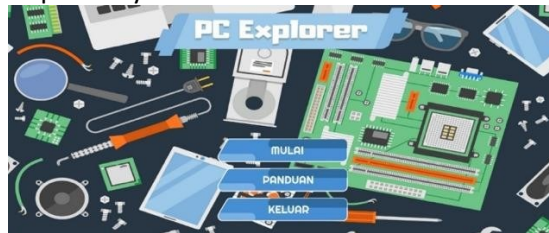
Gambar 1. Tampilan Beranda Aplikasi

Pada tampilan beranda akan menampilkan beberapa konten dari mulai, panduan dan keluar aplikasinya.