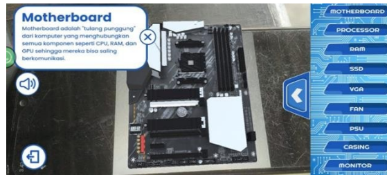
Gambar 3. Tampilan Hasil Scan Marker