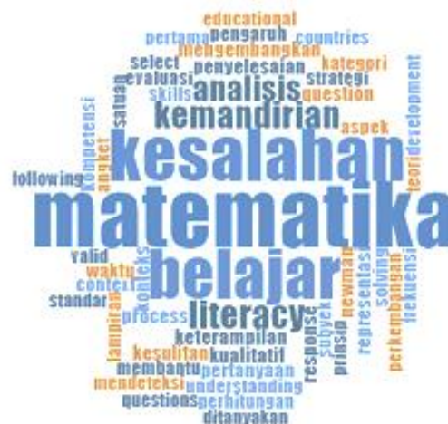
Gambar 1. Word Cloud dari 50 Kata Terdominan yang Muncul dalam Penelitian

Pada Gambar 1 menunjukkan 50 kata dominan dari semua sumber data penelitian disajikan dalam Word Cloud . Menggunakan fungsi Word Frequency Query akan menghasilkan Word Cloud dari beragam sumber data penelitian. Kata “matematika” merupakan kata dengan persentase kemunculan tertinggi yaitu 0,94% dari seluruh sumber data penelitian, disusul dengan kata “kesalahan”, “belajar”, “literacy”, “kemandirian”, “analisis” yaitu 0, 71%, 0.66%, 0.29%, 0.27% dan 0.24% dari semua sumber