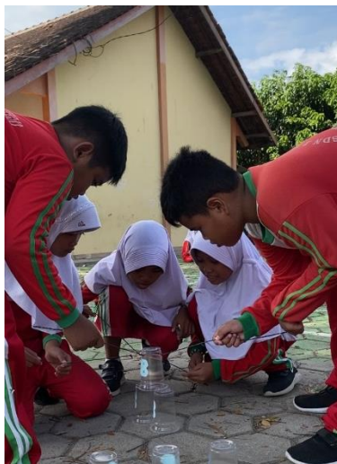
Gambar 3. Implementasi Permainan GUSEK PAMID.