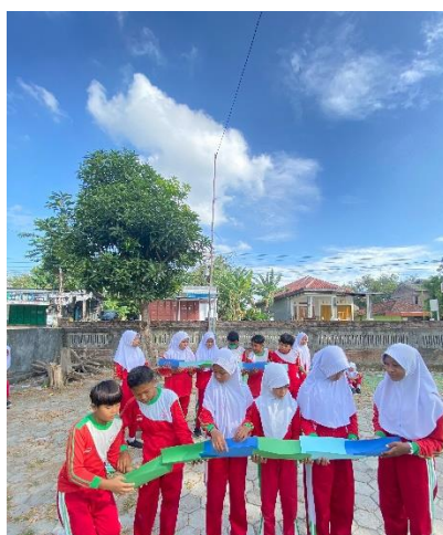
Gambar 2. Implementasi Permainan ESBOLTAS.

Pada tahap implementasi peneliti melakukan penelitian dengan mempraktikkan desain permainan berbasis AE kepada siswa secara langsung dengan cara menjelaskan mengenai AE dan permainan yang sudah dirancang peneliti dengan melibatkan 36 siswa dalam penelitian. Pada saat implementasi desain permainan berbasis AE yang dikembangkan untuk meningkatkan kemampuan motorik siswa, terlihat siswa-siswi sangat antusias dan bergerak aktif dalam melaksanakan semua permainan yang sudah dikembangkan. Pelaksanaan permainan ESBOLTAS dapat dilihat pada Gambar 2 dan permainan GUSEKPAMID pada Gambar 3.