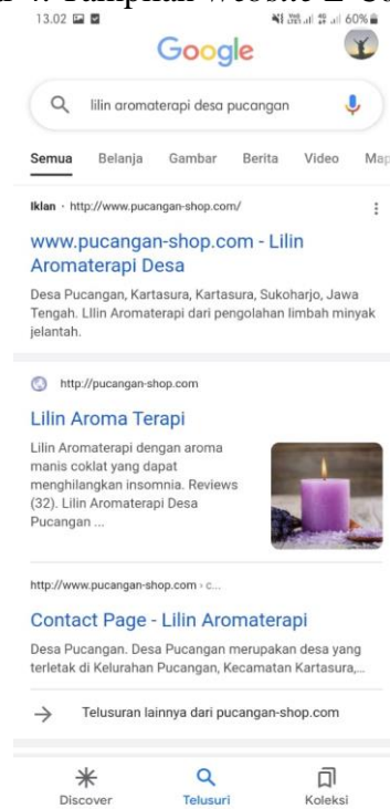
Gambar 6. Tampilan Iklan di Mesin Pencarian Google