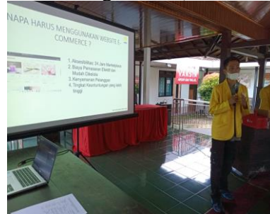
Gambar 4. Pemaparan Materi tentang Website E-Commerce dan Google Ads

produk yang di antaranya seperti dapat biaya pemasaran efektif dan mudah dikelola, dan tingkat keuntungan yang lebih tinggi. Setelah itu, dilanjutkan dengan penjelasan bagaimana cara membuat website e-commerce dan penjelasan tentang cara optimasi pemasaran menggunakan Google Ads (Gambar 4).