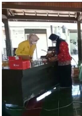
Gambar 3. Praktik Pembuatan Lilin Aromaterapi dan Partisipasi Aktif dari Ibu-Ibu Desa Pucangan

Partisipasi aktif dari ibu-ibu masyarakat Desa Pucangan tentang pembuatan lilin aromaterapi dari minyak jelantah menjadi tolak ukur keberhasilan dari tim PKM (Gambar 3).