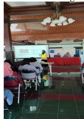
Gambar 2. Penyampaian Materi tentang Pengolahan Limbah Minyak Jelantah

Pelatihan pemanfaatan limbah minyak jelantah menjadi lilin aromaterapi layak jual dengan teknologi pemasaran website e-commerce dan Google Ads ini dilakukan Balai Desa Pucangan yang beralamat di Jalan Pandawa No. 1, Desa Pucangan, kecamatan Kartasura, kabupaten Sukoharjo. Kegiatan ini dimulai pada pukul 10.00-13.00 WIB, dan dihadiri oleh 30 orang ibu-ibu yang mewakili masing-masing RW di Desa Pucangan. Kegiatan sosialisasi yang dilakukan kepada ibu-ibu di Desa Pucangan, memberikan wawasan baru bagi mereka, tentang bagaimana pengolahan limbah minyak jelantah menjadi lilin aromaterapi dan kemudian memasarkan produk tersebut menggunakan teknologi website e-commerce dan Google Ads.