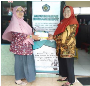
Gambar 5. Pemberian Robot kepada Pihak Sekolah Secara Simbolik