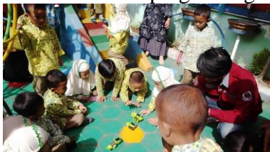
Gambar 7. Praktek Kegiatan