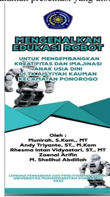
Gambar 3. Desain Banner Kegiatan

Untuk pelaksanaan metode ini kami melakukan pemaparan singkat tentang teknologi robot yang disusun dalam sebuah materi presentasi yang kami buat friendly untuk anak-anak usia dini, termasuk di dalamnya ada gambar-gambar robot agar bisa memancing daya imajinasi bagi para anak-anak untuk menyukai robot. Gambar 2 adalah contoh halaman presentasi yang dibuat.