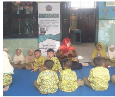
Gambar 9. Pembacaan Doa Penutup Kegiatan