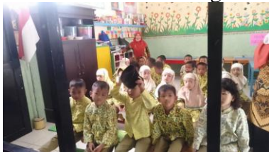
Gambar 8. Presentasi Kegiatan