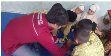
Gambar 6. Pendampingan Kegiatan