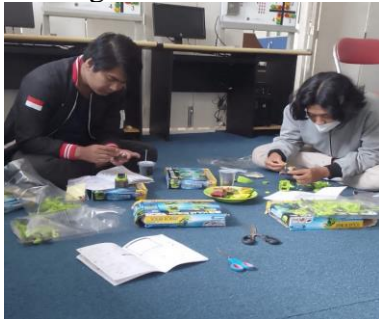
Gambar 4. Persiapan Perakitan Robot

peserta siswa-siswi yang hadir kami buat 5 kelompok, untuk setiap kelompoknya kami sediakan 1 buah robot yang siap dipraktikkan. Gambar 4-Gambar 9 menunjukkan rincian pelaksanaan kegiatan.