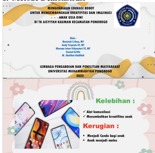
Gambar 2. Materi Presentasi

Untuk pelaksanaan metode ini kami melakukan pemaparan singkat tentang teknologi robot yang disusun dalam sebuah materi presentasi yang kami buat friendly untuk anak-anak usia dini, termasuk di dalamnya ada gambar-gambar robot agar bisa memancing daya imajinasi bagi para anak-anak untuk menyukai robot. Gambar 2 adalah contoh halaman presentasi yang dibuat.