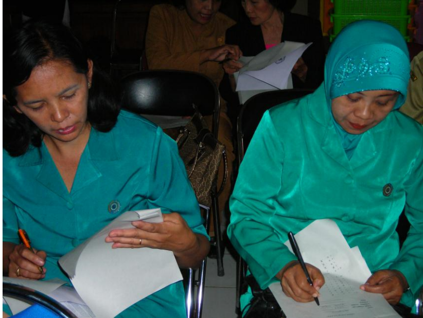
Gambar 1 Pelaksanaan tes awal & akhir