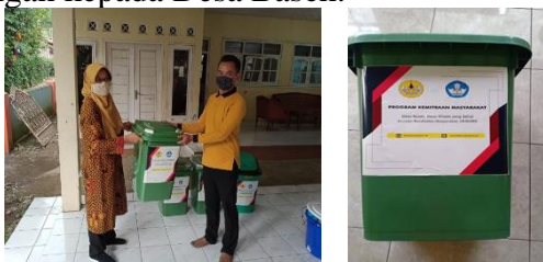
Gambar 4. Tempat sampah yang akan diletakkan di lokasi wisata di Desa Baseh

Selain itu juga disediakan tempat sampah di lokasi wisata. Ada 5 buah tempat sampah dengan volume 50 liter sampah yang ditempatkan di lokasi wisata di Desa Baseh. Berikut ini serah terima tempat sampah dengan kepada Desa Baseh.