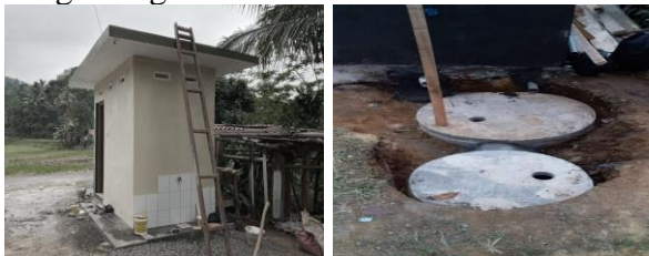
Gambar 3. Bangunan MCK di Situs Abah Kusuma Desa Baseh

Adanya kegiatan ini berhasil di bangun sebuah bangunan MCK permanen di lokasi obyek wisata situs Abah Kusuma. Bangunan ini digunakan para wisata untuk cuci tangan, dan buang hadas besar atau kecil. Bangunan ini sangat bermanfaat, apalagi saat pandemi Covid-19 ini, masyarakat harus rajin cuci tangan dengan sabun, termasuk saat berkunjung ke tempat wisata. dan setiap obyek wisata harus menyediakan sarana cuci tangan dengan sabun yang cukup. Bangunan MCK ini dilengkapi dengan septiktank, kran air cuci tangan, ember, gayung dan sabun. Masyarakat membantu dalam menyediakan sarana saluran listrik, jaringan air dan membantu menyelesaikan pekerjaan. Berikut ini bangunan MCK yang sudah dibangun dengan kegiatan kemitraan ini.