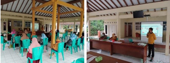
Gambar 1. Kegiatan Sosialisasi dan Pelatihan Tentang Pentingnya Kebersihan dan Kenyamanan Desa Wisata Pembentukan Kader Kesehatan Desa Wisata

sebelum dan sesudah. Rata-rata pengetahuan meningkat. Kegiatan saat sosialisasi dan pelatihan bagi tokoh masyarakat dan kader di Desa Baseh (Gambar 1).