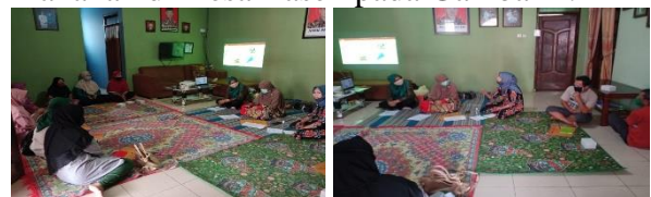
Gambar 2. Pelatihan Tentang Hygiene dan Sanitasi bagi Penjamah Makanan

pemahaman tentang pentingnya hygiene dan sanitasi bagi para penjamah makanan. Materi yang disajikan terdiri dari pentingnya hygiene dan sanitasi makanan, cara pemilihan bahan makanan yang baik, cara penyimpanan bahan makanan, cara pengolahan bahan makanan, cara pengangkutan bahan makanan, cara penyajian bahan makanan yang baik dan persyaratan penjamah makanan. (2) Diskusi business coaching untuk penjamah makanan di Desa Baseh. Kegiatan ini bertujuan untuk peningkatan kinerja, memecahkan masalah yang membutuhkan eksplorasi, perubahan perilaku, mengidentifikasi peluang baru dan membuat strategi bersama para pelaku usaha makanan di Desa Baseh. Saat kegiatan peserta aktif dan terjadi diskusi dan tanya jawab dengan narasumber, dan semua peserta mengikuti kegiatan sampai acara selesai. Hasil evaluasi kegiatan menunjukkan ada perubahan skor pengetahuan penjamah makanan tentang hygiene dan sanitasi makanan yaitu rata-rata skor pre test 8,0 naik menjadi 9,27 saat post test dan secara statistik bermakna ada perbedaan sebelum dan sesudah kegiatan ( p = 0,000 ), dengan peningkatan skor pengetahuan sebesar 13,7%. Hal ini menunjukkan kegiatan pendidikan dan pelatihan bagi penjamah makanan berhasil meningkatkan pengetahuan para penjamah makanan di Desa Baseh. Dokumentasi pelatihan hygiene dan sanitasi bagi penjamah makanan di Desa Baseh pada Gambar 2.