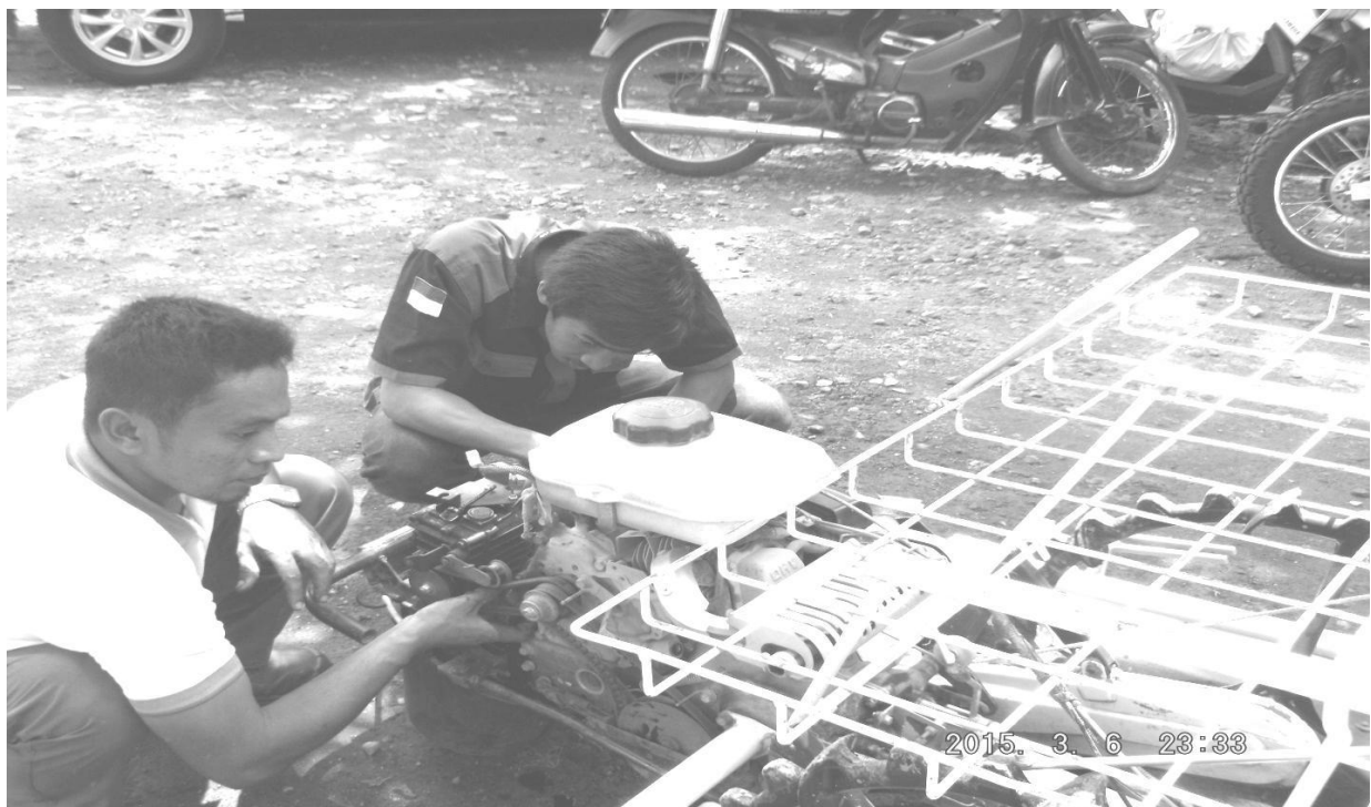
Gb. 3. Tengah pengecekan (penggantian/pengecekan belt)