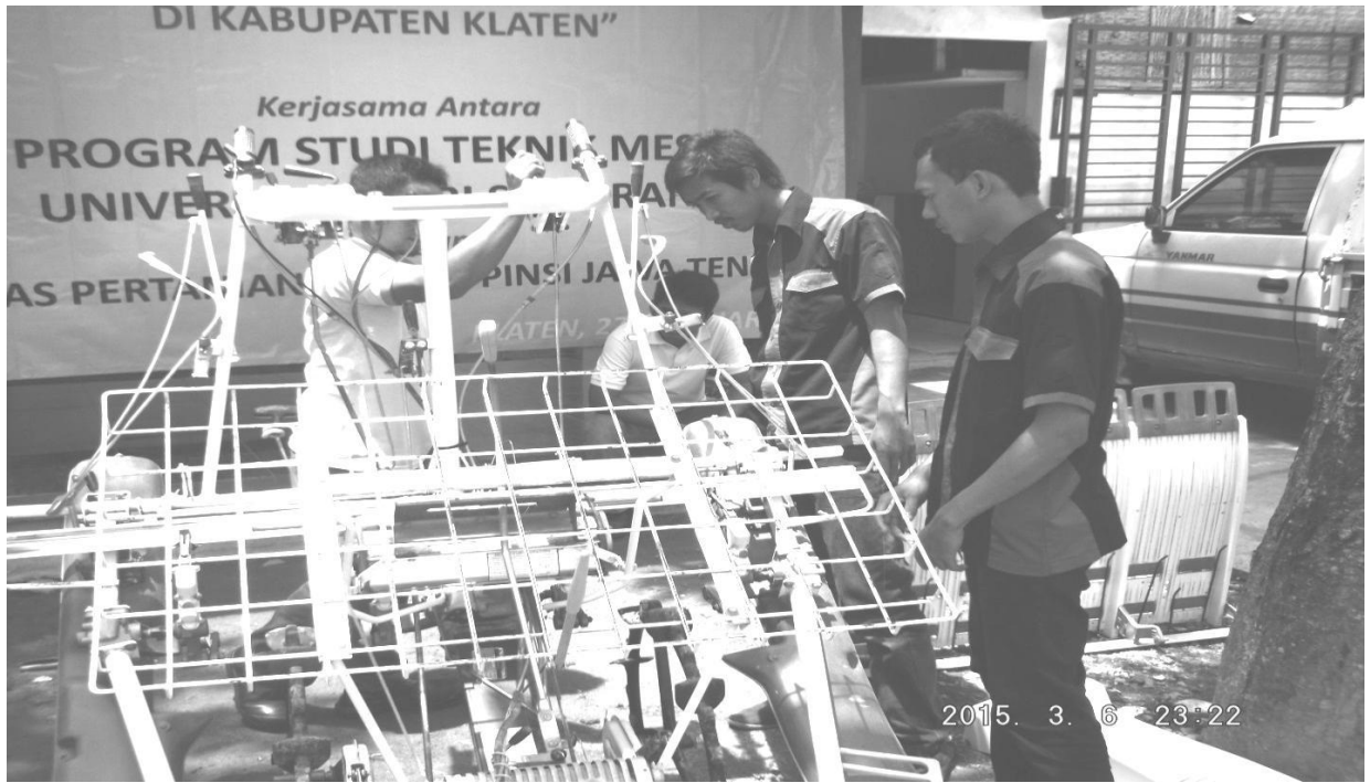
Gb. 4. Pengecekan akhir setting