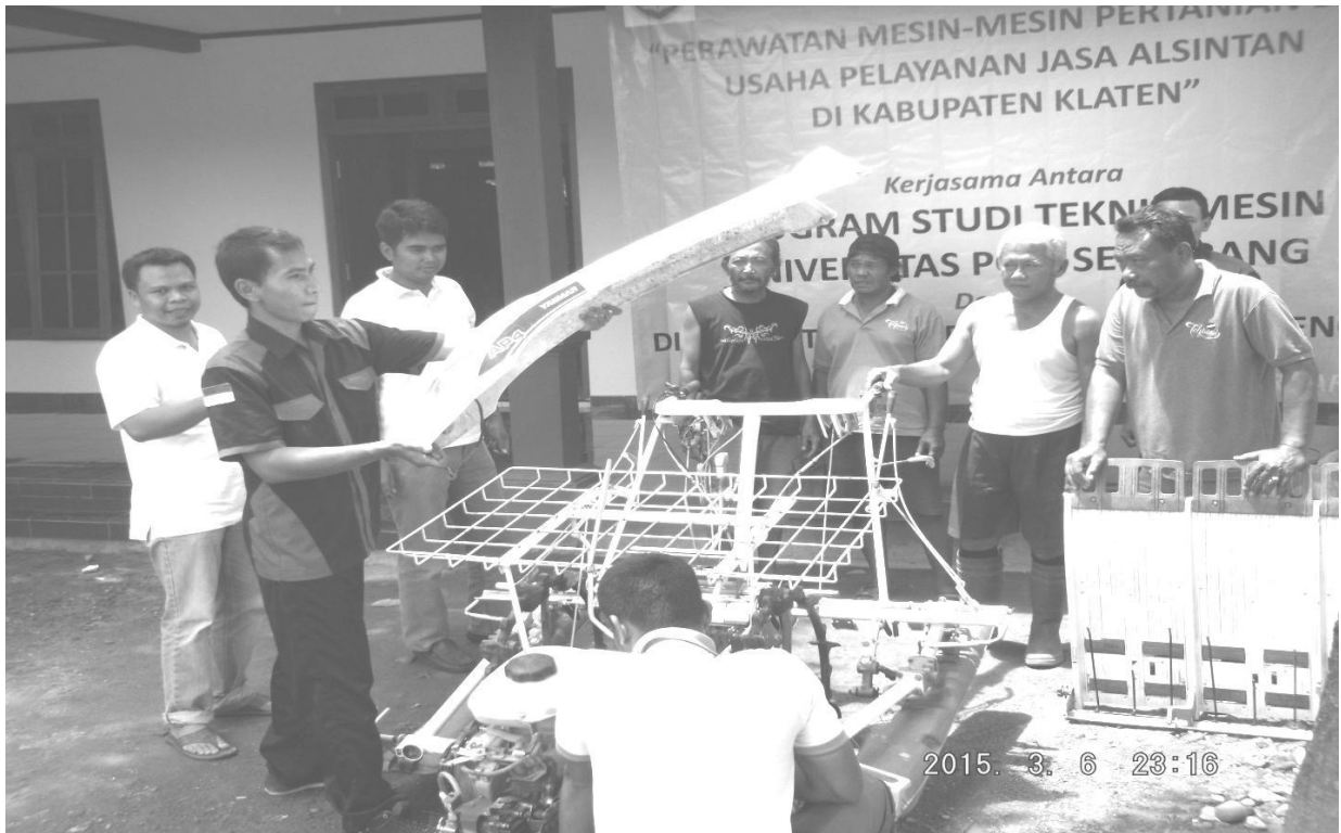
Gb. 2. Pengecekan awal (membuka kap mesin)