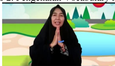
Gambar 3. Tutor PAUD Anak Bangsa III Semarang