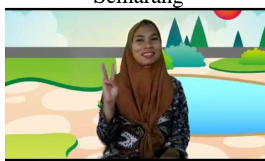
Gambar 4. Tutor PAUD Anak Bangsa III Semarang