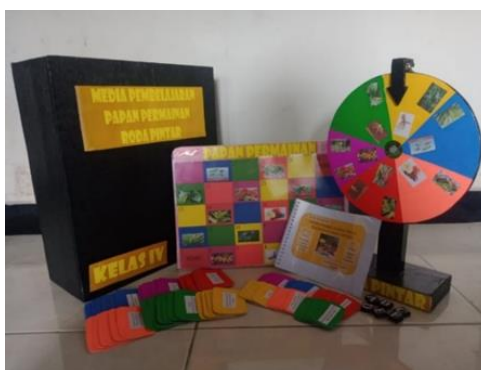
Gambar 1 Media Pembelajaran Papan Permainan Roda Pintar

Komponen roda pintar merupakan alat yang akan digunakan untuk menentukan warna kartu pertanyaan yang akan diambil untuk dijawab pada setiap kelompok. Komponen papan permainan merupakan papan yang digunakan untuk jalur pion maju sesuai dengan nomor kartu pertanyaan yang dapat dijawab dengan bernomor 1-30. Komponen kartu pertanyaan merupakan kartu yang ditujukan untuk setiap kelompok agar setiap kelompok menjawab pertanyaan yang telah didapat yang menyangkut tentang materi yang akan diajarkan. Komponen kartu jawaban merupakan kartu yang digunakan untuk mengetahui jawaban dari pertanyaan yang telah didapat. Komponen pion tempel merupakan pion yang digunakan untuk menandai letak tiap kelompok yang ditempelkan pada papan permainan. Komponen buku panduan merupakan buku yang berisi mengenai aturan atau langkah-langkah penggunaan media pembelajaran papan permainan roda pintar. Komponen buku materi pembelajaran merupakan buku yang berisi tentang penjelasan mengenai materi pembelajaran pada kelas IV mata pelajaran IPAS Bab 1 Tumbuhan, Sumber Kehidupan di Bumi pada Topik A Bagian Tubuh Tumbuhan.