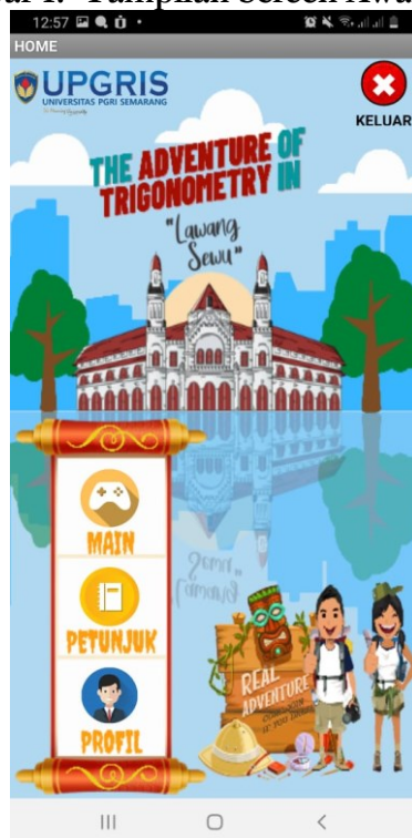
Gambar 2. Tampilan Menu Game