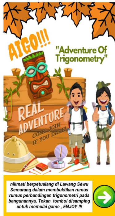
Gambar 1. Tampilan Screen Awal Game

Tahap pembuatan desain game ini meliputi pembuatan desain tampilan visual pada aplikasi android yang akan dibuat agar terlihat menarik, jelas, dan mudah digunakan serta siswa mudah memahami materi perbandingan trigonometri pada segituga siku-siku. Tahap pembuatan tampilan visual, peneliti menggunakan Canva . Adapun tampilan media yang telah dikembangkan adalah sebagai berikut: