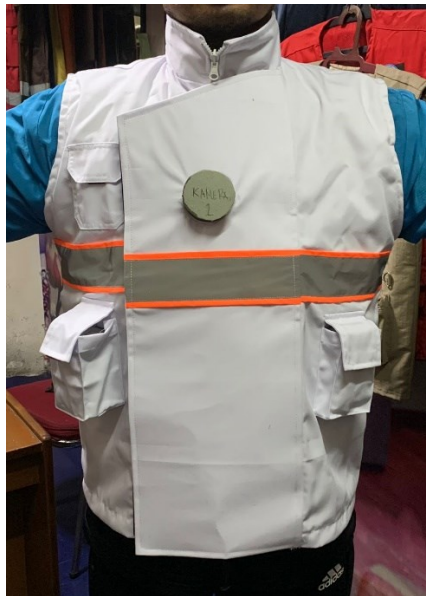
Gambar 4. Smart Jogging Vest