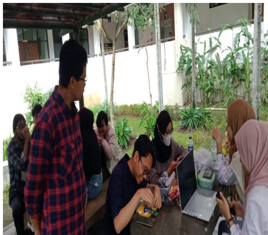
Gambar. 3 Tahap Pelaksanaan

Kegiatan pemaparan materi disampaikan oleh pemateri diselingi dengan sesi tanya jawab dan diskusi dengan para peserta. Pemateri juga meminta data dari peserta berupa rancangan konsep teknologi asistif yang akan dilakukan oleh peserta pelatihan serta mendiskusikan rancangan tersebut dengan pemateri. Pemateri juga memberikan contoh teknologi asistif yang sudah diterapkan dalam proses belajar mengajar dan membedahnya menurut kaidah teknologi asistif. Kegiatan ini bertujuan untuk memberikan penjelasan dan latihan yang lebih konkrit tentang bagaimana merancang teknologi asistif.