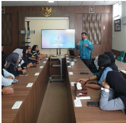
Gambar. 2 Berkorodinasi dengan MGMP PJOK Kabupaten Bandung Barat