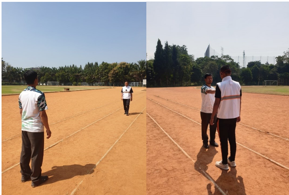
Gambar 5. Percobaan Alat Teknologi Asistif Pada Siswa Tunanetra

Individu dengan gangguan penglihatan atau tunanetra menghadapi berbagai tantangan signifikan dalam mencapai kemandirian, terutama dalam aktivitas sehari-hari dan menavigasi lingkungan mereka (Alfiqi & Sembiring, 2023). Tantangan ini meliputi kesulitan dalam mobilitas, interaksi sosial, dan pelaksanaan aktivitas sehari-hari (Aghazadeh et al., 2021; Koon et al., 2020).