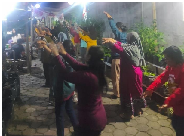
Gambar 1. Latihan Senam Irama

Latihan senam irama dilaksanakan tiga kali dalam satu minggu, biasanya latihan dilaksanakan pada malam hari. Alasan dilaksanakan latihan pada malam hari yakni mengingat mulai pagi hingga sore hari kebanyakan masyarakat kelurahan Kauman sedang bekerja. Durasi latihan senam irama ini kurang lebih 1-2 jam setiap pertemuan. Salah satu kendala yang dialami saat melakukan latihan senam irama yakni ruang gerak yang terbatas, hali ini disebabkan minimnya lahan yang cukup luas untuk melakukan latihan senam irama.