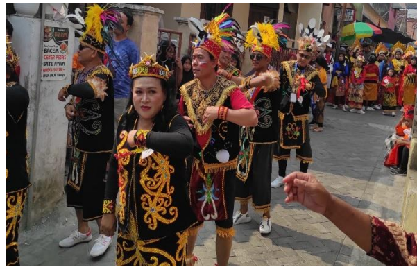
Gambar 2. Penampilan Senam Irama