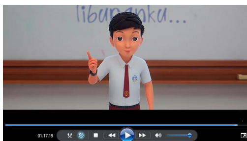
Gambar 4.10 Adit bercerita dihadapan teman kelasnya

Yaitu tindakan yang memperlihatkan rasa senang berbicara, bergaul, dan bekerjasama dengan orang lain. Dalam tayangan film animasi Adit Sopo Jarwo The Movie yang menunjukkan komunikatif atau bersahabat dan selalu hidup rukun dan saling menyayangi. Pada menit 01.17.19 Adit bercerita disekolah tentang perjalanan liburannya ke Jogjakarta bertemu dengan bang Jarwo dan sopo hingga satu truk dengan kerbau