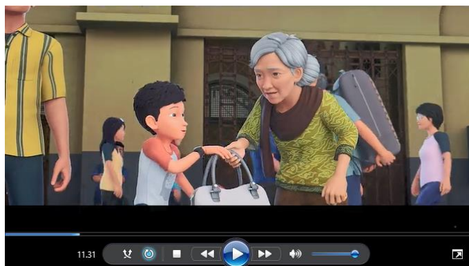
Gambar 4.14 Adit meminta maaf kepada nenek