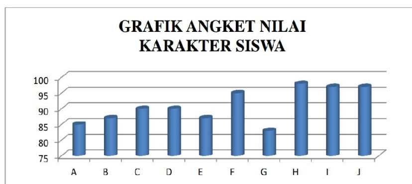
Grafik 4.1 Angket Nilai Karakter Siswa