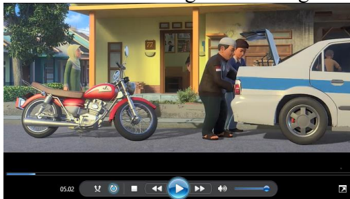
Gambar 4.11 Pak haji membantu ayah adit memasukkan barang ke mobil

Yaitu sikap dan tindakan yang ingin memberikan bantuan pada orang lain dan masyarakat yang membutuhkan. berbagi kepada sesama makhluk sosial. Dalam tayangan film animasi Adit Sopo Jarwo The Movie yang menunjukkan sikap peduli sosial menit 05.21 Pak haji membantu ayah adit memasukkan barang bawaannya kedalam bagasi mobil tanpa paksaan. Kemudian pada menit 57.17 Sopo dan Jarwo menolong adit yg jatuh kedalam sumur dengan bambu agar adit bisa naik ke atas.