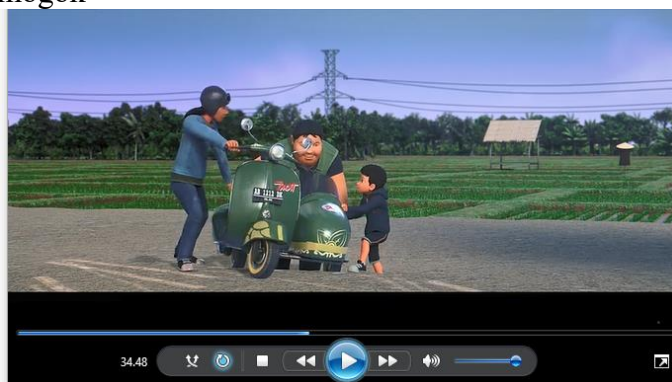
Gambar 4.9 Adit dan sopo bekerja keras membantu mendorong motor

Yaitu cara yang harus dilakukan untuk memenuhi sesuatu yang akan diraihnya. Namun untuk memenuhi kebutuhan, kerja keras harus dilakukan dengan pekerjaan yang baik. Pada tayangan film animasi Adit Sopo Dan Jarwo The Movie menit 34.48 Adit dan sopo bekerja keras membantu mengangkat dan mendorong motor seseorang yang mogok