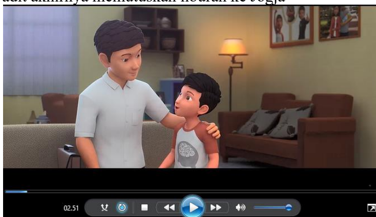
Gambar 4.13 Adit menanyakan liburan ke Jepang

Yaitu tindakan yang ingin mengetahui sesuatu secara mendalam dan meluas dari sesuatu yang telah dipelajari, dilihat dan didengar. Dalam tayangan film animasi Adit Sopo Jarwo The Movie yang menunjukkan rasa ingin tahunya menit 02.51 Adit menanyakan persiapan liburan ke Jepang kepada ayahnya. Namun karena ada kendala ayah adit akhirnya memutuskan liburan ke Jogja