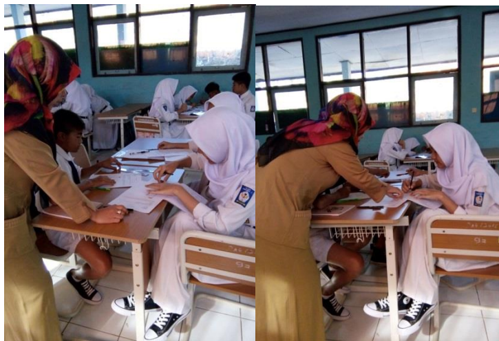
Gambar 1. Salah satu kegiatan guru dalam membangun motivasi

Selama proses pembelajaran berlangsung dilakukan observasi untuk mengetahui keterlaksanaan dari pembelajaran berbasis masalah dengan green's motivational strategies . Dalam penelitian ini yang mengajar adalah guru matematika pada kelas tersebut yang telah diberi arahan oleh peneliti tentang pelaksanaan pembelajaran. Peneliti mengobservasi kegiatan pembelajaran yang dilakukan guru. Pada pembelajaran berbasis masalah dengan green's motivational strategies , peran guru sangat besar dalam membangun motivasi siswa dalam belajar. Motivasi yang diberikan tidak hanya dalam lembar kerja siswa yang telah disusun, tetapi juga dalam bentuk verbal yang dilakukan oleh guru.