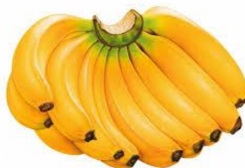
Gambar 2. Satu Epek Pisang

Seorang pedagang buah di pasar Bumiayu menjual pisang epek dan pisang raja. Di tokotersebut penjualannya sebanyak 18 Epek dengan standar deviasi 5 dan pisang kepek sebanyak 12 epek dengan standar deviasi 4. Ujilah rasio pisang kepek terhadap pisang raja melebihi 20! jika diambil \alpha=5\% ?. Epek adalah satuan lokal orang bumiayu yang digunakan untuk buah pisang.