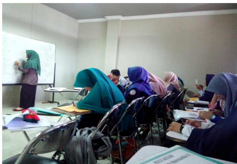
Gambar 3. Mahasiswa Menyajikan Hasil Karya

Mahasiswa mencari permasalahan dan berusaha menyelesaikan permasalahan. mahasiswa melakukan konsultasi secara bertahap dalam menyelesaikan masalah yang ada. Setelah permasalahan selesai. Mahasiswa membuat makalah dari hasil kerja sama mereka dalam kelompok. Mahasiswa menyajikan hasil karya dan melakukan diskusi kelompok. Setelah tahap menyajikan hasil karya, mahasiswa dan dosen melakukan evaluasi dan refleksi terhadap hasil diskusi tersebut.