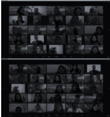
Gambar 1. Suasana Kelas Daring PPG Catatan: Penulis Sengaja Menyamarkan Gambar untuk Melindungi Identitas Mahasiswa PPG di Kelasnya.

mencari, dan mengunduh literatur terkait dengan penyebab masalah yang sudah mereka eksplorasi di pertemuan sebelumnya. Setelahnya, penulis meminta para mahasiswa untuk menyimpan literatur yang sudah diunduh di laptop atau perangkat komputernya masing-masing. Kemudian, penulis meminta mereka untuk menuliskan daftar pustaka dari literatur tersebut menggunakan format APA 7 th ed pada dokumen Google Sheet ( https://www.google.com/sheets/about/ ) yang sudah mereka buat di beberapa pertemuan sebelumnya ketika mereka menuliskan identifikasi dan penyebab masalah terkait praktik pembelajaran dan pengajaran Bahasa Inggris yang ada di kelas mereka masing-masing.