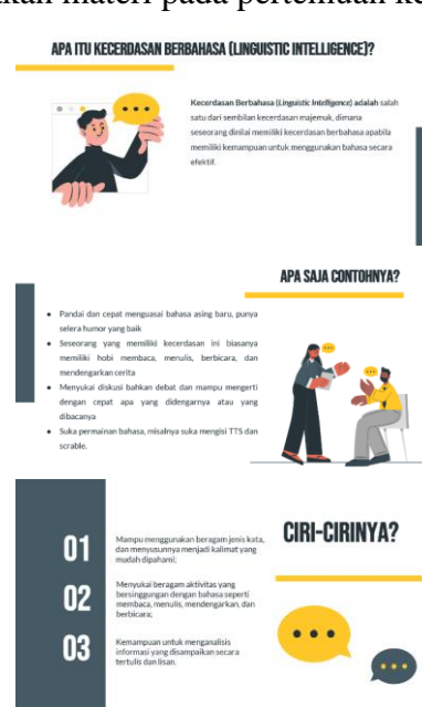
Gambar 2. Tim Memberikan Materi Sosialisasi tentang Kecerdasan Berbahasa (Dey et al., 2020)

Pertemuan kedua diawali dengan brainstorming berupa pengenalan dan pengidentifikasian pengetahuan kecerdasan berbahasa pada anak asuh. Pada pertemuan ini, tim pengabdian memberikan materi selang pandang tentang kemampuan berbahasa, yang pada awal pertemuan para anak asuh diminta untuk berkenalan menggunakan dua bahasa yaitu Bahasa Inggris dan Bahasa Indonesia. Hal ini dimaksudkan untuk mengetahui kemampuan berbahasa mereka sehingga dapat digunakan oleh tim pengabdian untuk bahan dalam mengarahkan mereka untuk lebih paham akan potret kemampuan berbahasa mereka dan meminta atau mengarahkan mereka untuk lebih menggali potensi berbahasa mereka dengan menggunakan media yang ada pada saat ini, di mana digitalisasi telah merambah ke berbagai aspek kehidupan. Gambar 2 merupakan materi pada pertemuan kedua.