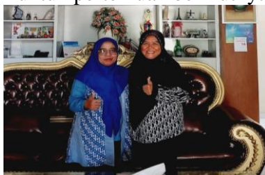
Gambar 1. Ketua Tim Bersama Ketua Yayasan Panti Asuhan Berdiskusi tentang Bentuk Kegiatan sekaligus Analisis Permasalahan (Dey et al., 2020)

Pada pertemuan pertama, tim pengabdian berdiskusi dengan Ketua Pengasuh Panti Asuhan Yatim Piatu Putri Yayasan Soetopo Sridadiyah Saputro (YS3) (Gambar 1). Pada diskusi ini tim pengabdian menyampaikan maksud dan tujuan dilaksanakannya kegiatan pengabdian yaitu tentang pemberian materi sosialisasi tentang kecerdasan berbahasa dan bagaimana cara untuk dapat mengoptimalkan kecerdasan berbahasa dengan media digital. Pada pertemuan ini, ketua yayasan menyampaikan bahwa anak-anak penghuni Panti Asuhan YS3 rajin dan bersemangat untuk belajar, juga belajar bahasa Inggris. Karena berasal dari latar belakang yang berbeda-beda, anak-anak asuh di Yayasan YS3 ini juga mengatakan bahwa mereka bersedia belajar bersama dan senang apabila diajak main game sambil belajar. Pada akhir pertemuan pertama ini, diperoleh kesepakatan untuk teknik penyampaian dan isi materi untuk pertemuan berikutnya.