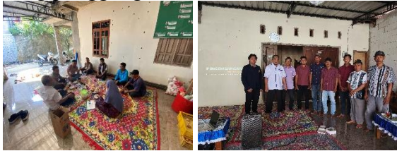
Gambar 1. Proses Survei

Berdasarkan data dari Badan Pusat Statistik (2021), Kabupaten Pati, kontribusi sektor pertanian terhadap PDRB Kabupaten Pati mencapai 25% pada tahun 2021, yang menunjukkan bahwa sektor ini merupakan tulang punggung ekonomi daerah.