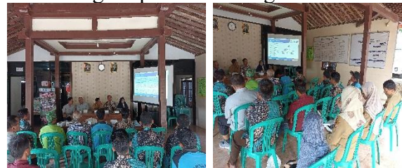
Gambar 2. Proses FGD

Proses perumusan metode pengabdian dilakukan setelah tim mengidentifikasi permasalahan yang dihadapi masyarakat di Desa Gunungsari melalui diskusi kelompok terfokus ( Focus Group Discussion/FGD , lihat Gambar 2) yang dianggap cara paling efektif dalam proses penyampaian materi kepada masyarakat (Prakoso, et al., 2024). Kegiatan ini yang diikuti oleh perwakilan desa serta kelompok tani kopi, yaitu Kelompok Tani Wana Lestari dan Gunungsari Indah. Berdasarkan hasil diskusi tersebut, tim merancang metode pelaksanaan pengabdian yang mencakup desain penyampaian materi serta strategi implementasi kegiatan.