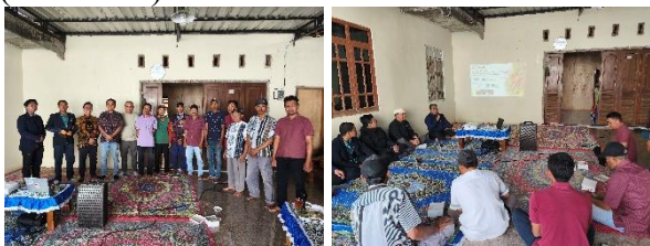
Gambar 3. Proses Sosialisasi

Kegiatan pengabdian dilaksanakan melalui penyampaian materi secara ceramah yang didukung oleh media presentasi berupa slide PowerPoint. Kegiatan ini berlangsung di Balai Desa Gunungsari dan mendapatkan respons positif serta dukungan penuh dari masyarakat, terutama dari kelompok tani kopi, sebagaimana tercermin dari partisipasi yang tinggi. Acara dihadiri oleh 25 peserta, terdiri atas 2 perangkat desa, 18 anggota kelompok tani, dan 5 anggota tim pelaksana. Dalam kegiatan tersebut, tim menyampaikan materi tentang pentingnya penerapan sistem agroforestri dalam budidaya kopi sebagai bagian dari pendekatan pertanian organik, dengan memanfaatkan kulit kopi limbah hasil pengolahan sebagai bahan utama pembuatan kompos yang baik untuk lingkungan yang berkelanjutan (Alpandari & Prakoso, 2022) menjadi langkah awal dalam penerapan eduecowisata yang mengukung rantai budidaya tanaman kopi hingga siap konsumsi (Gambar 3).