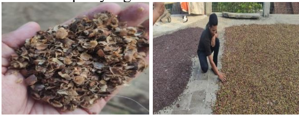
Gambar 4. Proses Pengomposan Kulit Kopi

Peserta pelatihan pembuatan pupuk organik dari kulit kopi mengikuti pre-test dan post-test untuk mengevaluasi sejauh mana penyelenggara berhasil (Winarso et al., 2023) mentransfer pengetahuan dan teknologi. Hasil pre-test dan post-test menunjukkan bahwa terdapat peningkatan pemahaman yang baik mengenai pengomposan dan eduecowisata.