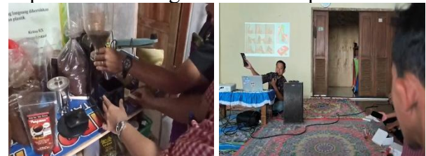
Gambar 6. Proses Sosialisasi dan Pendampingan Pengemasan Produk

Selain itu hasil tersebut menunjukkan efektivitas pelatihan dalam mentransfer pengetahuan dan keterampilan kepada peserta. Secara khusus, peserta kini tidak hanya memahami cara pembuatan kompos dan bahan yang digunakan, tetapi juga manfaat kompos, konsep agroforestri, serta hubungan antara pembuatan kompos dengan eduecowisata. Dengan kata lain, pelatihan ini berhasil meningkatkan pengetahuan peserta secara signifikan dalam waktu yang relatif singkat. Kekurangan dari kegiatan ini adalah pertanyaan dalam instrumen yang dibuat harus menggunakan istilah-istilah yang awam untuk dapat lebih dimengerti oleh koresponden.