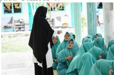
Gambar 2. Santri Melakukan Permainan Peran ( Role-Play ) sebagai Simulasi Percakapan dalam Konteks Formal dan Non-Formal

Kegiatan inti berupa pelatihan praktik komunikasi bahasa asing dilakukan melalui berbagai metode seperti simulasi percakapan, permainan peran ( role-play ) pada Gambar 2, latihan pengucapan ( drill practice ) pada Gambar 3, dan permainan bahasa ( language games ) pada Gambar 4.