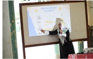
Gambar 3. Latihan Pengucapan ( Drill Practice ) sebagai Praktik Komunikasi untuk Ketepatan Pelafalan Bahasa Asing Pada aktivitas drill practice terbukti efektif sebagai bentuk behavioral reinforcement yang memperkuat daya ingat dan kepercayaan diri.

mencapai 92%, yang mencerminkan keterlibatan tinggi dalam kegiatan praktik.