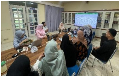
Gambar 1. Diskusi Bersama Tim Terkait Persiapan Kegiatan Pengabdian Masyarakat di Dayah Terpadu Al-Muslimun

dan penyusunan perangkat pembelajaran yang disesuaikan dengan kondisi santri pada Gambar 1.