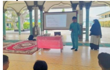
Gambar 4. Kegiatan Permainan Bahasa untuk Meningkatkan Pengusaan Kosakata Kegiatan permainan bahasa dilakukan dalam bentuk kompetisi kelompok: (1) Word chain , (2) Guess the word , dan (3) Sentence race untuk memperluas kosakata serta menciptakan suasana belajar yang interaktif. Hasil pengukuran pre-test dan post-test menggunakan skala Likert menunjukkan adanya peningkatan minat belajar bahasa asing secara signifikan berdasarkan Tabel 1.