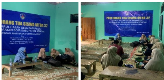
Gambar 2. Pendampingan Transformasi Kesadaran Orang Tua terhadap Hak Anak

Indikator awal yang muncul dari kegiatan pendampingan ini memberikan gambaran bahwa proses penguatan kapasitas orang tua sedang bergerak ke arah yang positif. Meski demikian, perubahan yang dilaporkan masih berada pada tahap pembentukan nilai dan membutuhkan waktu untuk benar-benar menyatu dalam praktik pengasuhan sehari-hari. Sebagian orang tua mulai mencoba pendekatan baru yang lebih dialogis, namun mereka tetap memerlukan ruang belajar yang berkelanjutan agar perubahan tersebut semakin stabil dan tidak mudah kembali pada pola lama. Dalam konteks pengabdian kepada masyarakat, kesinambungan program menjadi pondasi penting agar pemahaman yang diperoleh tidak berhenti sebagai wawasan sesaat, tetapi tumbuh menjadi kebiasaan yang mengakar dalam budaya keluarga. Karena itu, keberadaan forum refleksi, komunikasi yang rutin antara sekolah dan orang tua, serta pertemuan berkala yang memperkuat praktik pengasuhan positif sangat diperlukan untuk memastikan bahwa transformasi awal ini berkembang menjadi perubahan yang hidup dan berdampak nyata bagi tumbuh kembang anak.