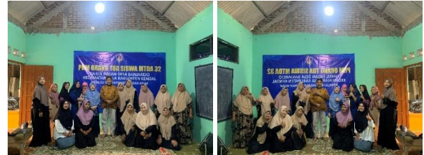
Gambar 4 Penguatan Kemitraan Keluarga dan Sekolah sebagai Fondasi Masyarakat Ramah Anak

sekolah, dan keluarga dapat merancang program berkelanjutan yang memperkuat ekosistem perlindungan serta meningkatkan partisipasi anak di lingkungan MTDA 32 Darul Hasan.