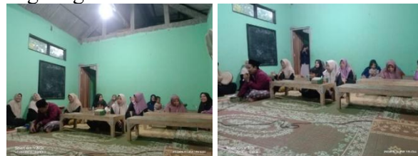
Gambar 5. Penguatan Peran Komunitas dan Keberlanjutan Program Menuju Masyarakat Ramah Anak

Pendampingan yang diberikan kepada orang tua tidak hanya berdampak pada pola komunikasi di dalam keluarga, tetapi juga mulai terlihat dalam dinamika sosial yang lebih luas. Perangkat desa menunjukkan ketertarikan untuk terlibat, orang tua mulai menginisiasi bentuk-bentuk dukungan baru, dan sekolah membuka ruang dialog yang lebih inklusif. Interaksi yang muncul dari berbagai pihak ini memberi sinyal bahwa ekosistem perlindungan dan partisipasi anak sedang bergerak ke arah yang lebih terkoordinasi. Situasi tersebut menjadi titik penghubung yang penting untuk mengarahkan pembahasan pada langkah-langkah integrasi program serta peluang kolaborasi lanjutan yang dapat menjaga keberlangsungan perubahan positif di lingkungan MTDA 32 Darul Hasan.