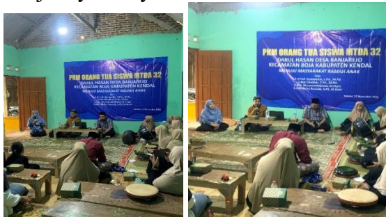
Gambar 3. Transformasi Pola Interaksi Keluarga melalui Komunikasi Dialogis

titik pijak bagi pembahasan selanjutnya mengenai bagaimana kemitraan antara keluarga dan sekolah berperan dalam membangun ekosistem yang mendukung terwujudnya masyarakat ramah anak