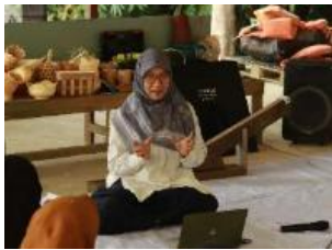
(a) Pemaparan Materi Branding