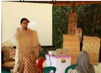
(a) Demonstrasi Produk