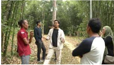
Gambar 1. Proses Koordinasi Bersama Stakeholder

menjadi fokus kegiatan, yaitu produksi, pemasaran dan branding, serta manajemen usaha, yang secara sistematis membentuk rantai nilai produk bambu dari proses awal hingga siap dipasarkan (Gambar 2).