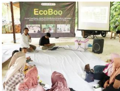
Gambar 6. Proses Pelatihan Manajemen Usaha

Tahap ketiga difokuskan pada penguatan kapasitas peserta dalam aspek manajerial (Gambar 6). Materi mencakup perencanaan produksi, pencatatan keuangan sederhana, dan strategi pemasaran digital yang aplikatif. Setelah pelatihan, masyarakat mulai menerapkan pencatatan transaksi secara terstruktur dan membuat perencanaan produksi untuk memenuhi permintaan wisatawan. Selain itu, peserta memahami pentingnya konsistensi kualitas dan pengelolaan stok sebagai faktor pendukung keberlanjutan usaha kecil berbasis bambu.