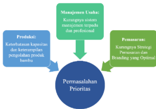
Gambar 2. Skema Aspek Permasalahan Prioritas