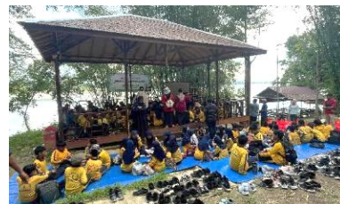
Gambar 8. Pelaksanaan EcoBoo bagi Wisatawan

Hasil pelaksanaan EcoBoo menunjukkan antusiasme tinggi dari wisatawan dengan total 120 peserta pada kegiatan perdana (Gambar 8). Masyarakat lokal berhasil menjalankan peran sebagai instruktur utama dengan baik, mulai dari pengenalan bambu hingga praktik pembuatan produk. Wisatawan aktif berpartisipasi dalam seluruh rangkaian kegiatan, sehingga tercipta interaksi yang erat antara pengunjung dan komunitas. Selain memberikan pengalaman wisata edukatif yang berkesan, kegiatan ini juga memperkuat citra Ekowisata Bamboe Wanadesa sebagai destinasi berbasis kearifan lokal dan keberlanjutan. Program ini sekaligus menjadi sarana promosi efektif melalui pengalaman langsung yang mendorong wisatawan untuk merekomendasikan destinasi tersebut kepada pihak lain.