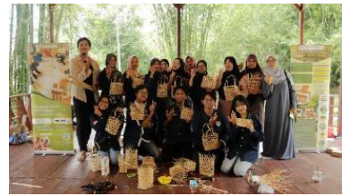
Gambar 7. Simulasi EcoBoo

pengaturan waktu dan ketersediaan alat. Umpan balik dari simulasi ini menjadi dasar perbaikan alur kegiatan dan penyempurnaan materi pelatihan sebelum program dibuka untuk wisatawan.