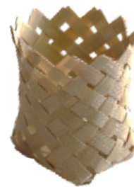
(a) Wadah Sendok

sederhana. Melalui pendekatan praktik langsung, peserta berhasil menghasilkan beberapa jenis produk fungsional seperti tatakan gelas, vas mini, dan gantungan kunci. Produk yang dihasilkan memiliki kualitas cukup baik dan dapat dijadikan cendera mata di kawasan ekowisata. Selain peningkatan keterampilan teknis, pelatihan ini juga memperkuat kepercayaan diri masyarakat dalam mengelola potensi bambu sebagai sumber pendapatan tambahan.