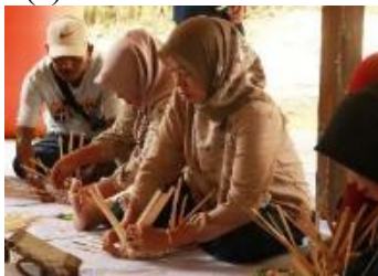
(b) Praktik Pembuatan Produk