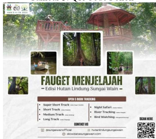
Gambar 4. Spanduk Kegiatan