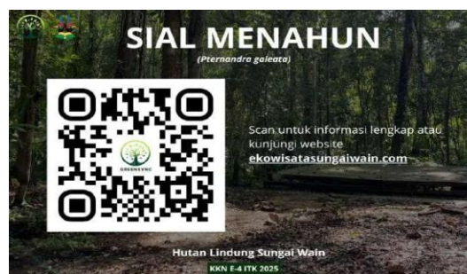
Gambar 3. QR Code Pohon

endpoint API, integrasi database , autentikasi, dan panel admin, serta fitur utama berupa informasi paket wisata, galeri flora–fauna, sistem booking online , dan integrasi identitas QR Code pohon untuk menyatukan pengalaman lapangan dan akses digital. Evaluasi kuesioner menunjukkan mayoritas responden sangat setuju atau setuju bahwa QR Code meningkatkan minat belajar, buku memperkuat pengenalan spesies dan niat menjaga kelestarian, serta situs memudahkan akses informasi dan mengenalkan kawasan secara digital, sekaligus menandai perlunya penguatan ketersediaan informasi daring pada aspek tertentu. Sinergi ketiga luaran membentuk ekosistem digital konservasi–ekowisata yang meningkatkan keterjangkauan informasi, memperkaya interpretasi biodiversitas di lapangan, dan memudahkan pengelolaan konten serta promosi oleh pengelola HLSW, yang ditunjang bukti luaran berupa publikasi laman institusi, dokumentasi video, serah terima inovasi, buku literasi, dan penerbitan website .