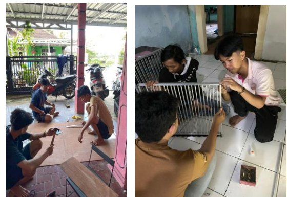
Gambar 4. Proses Perakitan Alat Penetas Telur

Alat penetas telur dirancang dengan sistem dua rak, sensor suhu dan kelembaban, serta alat pemutar otomatis. Proses pembuatan alat mesin tetas yang ditunjukkan pada Gambar 4 memakan waktu 3 minggu. Beberapa kendala saat perakitan adalah tidak berfungsinya beberapa part, seperti kipas angin, dudukan lampu, serta saklar yang menyebabkan waktu perakitan menjadi tidak sesuai jadwal. Uji coba alat penetas telur dimulai pada 14 Mei 2025, yang berlokasi di balai desa RT. 32 Kecamatan Karang Joang. Percobaan fungsi dari setiap fitur dilakukan sebelum alat diserahkan pada masyarakat. Selain itu, pengujian dengan telur tetas juga dilakukan untuk melihat performa alat pemutar otomatis serta distribusi suhu. Gambar 5 menunjukkan hasil akhir dari mesin tetas otomatis serta pengujian yang dilakukan dengan telur ayam kampung.