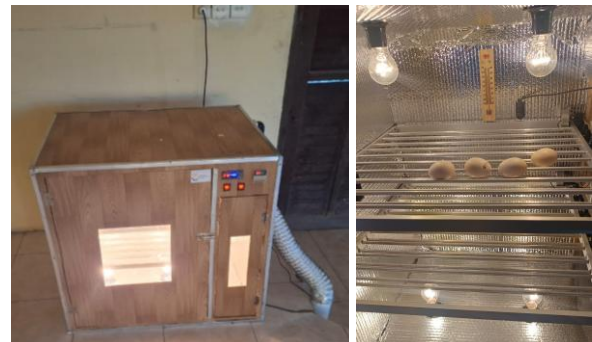
Gambar 5. Hasil Alat Penetas Telur dan Uji Fungsi Penetasan Telur Ayam Kampung