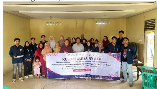
Gambar 3. Dokumentasi Saat Pembukaan Kegiatan Pengabdian Masyarakat

pada Gambar 3. Acara ini bertujuan untuk memperkenalkan anggota tim pengabdian masyarakat kepada masyarakat setempat, serta menyampaikan berbagai program kerja yang akan dilaksanakan selama masa pengabdian masyarakat berlangsung. Acara pembukaan ini dihadiri oleh 37 orang, termasuk 16 warga RT. 32. Tim pengabdian masyarakat menyebarkan kuesioner kepada warga untuk mengetahui tanggapan dan harapan terhadap kegiatan pengabdian masyarakat. Tabel 1. menunjukkan data yang didapatkan berdasarkan kuisisioner yang diberikan pada pembukaan kegiatan pengabdian masyarakat. Hasil kuisisioner menunjukkan bahwa mayoritas warga memberikan dukungan positif terhadap pelaksanaan program, menandakan antusiasme dan partisipasi aktif masyarakat dalam mendukung kegiatan yang akan dijalankan. Tingkat pemahaman masyarakat mengenai penetasan telur ayam masih rendah dengan rata-rata 51,25% (ragu-ragu), bahkan sebagian besar belum mengetahui inovasi alat penetas telur (33,75% tidak mengetahui).