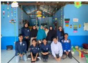
Gambar 3. Dokumentasi Pelatihan Pembuatan Media Pembelajaran dengan Canva 3. Pembuatan Konten Video Pembelajaran dan Promosi

Kegiatan ini bertujuan untuk melatih guru-guru untuk membuat konten video baik untuk keperluan pembelajaran, maupun untuk keperluan promosi sekolah. Pelatihan editing video menggunakan aplikasi CapCut terbukti efektif meningkatkan keterampilan teknis dan kreativitas peserta dalam menghasilkan konten edukatif; misalnya, pelatihan di kalangan guru untuk meningkatkan kemampuan editing dan antusiasme dalam memproduksi video pembelajaran pendek (Alfathoni, M. A. M., Sya'dian, T., Azizah, A., & Purba, R. (2023). Aktivitas dalam kegiatan ini berupa pembuatan video pembelajaran dan promosi menggunakan aplikasi Capcut yang dipublikasikan di media sosial. Tim