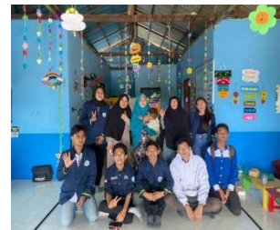
Gambar 4. Dokumentasi Pelatihan Pembuatan Konten Video Pembelajaran dan Promosi 4. Pembuatan Akun Sosial Media untuk Promosi

Pengembangan akun media sosial sekolah merupakan strategi efektif untuk meningkatkan branding dan profesionalisme lembaga PAUD seperti pelatihan yang menekankan konten kreatif, manajemen posting, dan interaksi digital terbukti meningkatkan engagement dan citra positif di masyarakat (Sudarso et al., 2024). Kolaborasi dalam mengelola akun media sosial Instagram secara rutin oleh tim dan guru dalam membuat dan mempublikasikan konten untuk mengenalkan program pendidikan dan kegiatan sekolah.