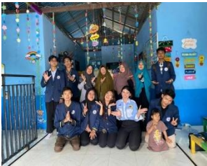
Gambar 2. Dokumentasi Pelatihan Dasar Teknologi Digital untuk Pengajaran