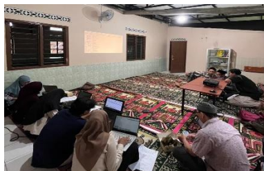
Gambar 4. Sosialisasi dan Pelatihan pengisian Sistem Informasi Jamaah (SI-Jamaah)

Gambaran kegiatan sosialisasi dan pelatihan pengisian sistem Profil Jama'ah Masjid, sebagaimana ditunjukkan dalam Gambar 4.