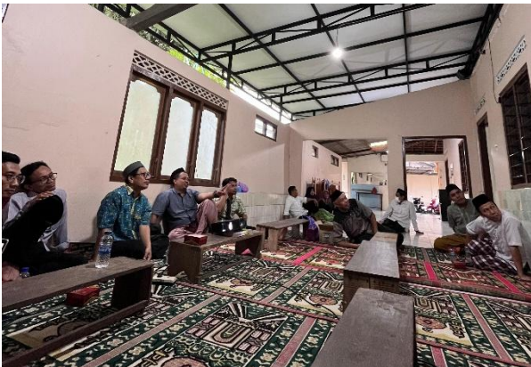
Gambar 5. Penyusunan Strategi Dakwah Masjid Al-Hikmah.

Pendekatan ini juga memperkuat fungsi masjid sebagai pusat pembinaan umat yang responsif terhadap dinamika sosial masyarakat. Dengan memanfaatkan data profiling jamaah, Masjid Al-Hikmah tidak hanya melakukan digitalisasi administrasi, tetapi juga melakukan digitalisasi perencanaan dakwah secara strategis. Gambaran kegiatan Penyusunan strategi dakwah, sebagaimana ditunjukkan dalam Gambar 5.