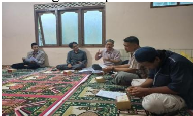
Gambar 2. Penyusunan Template Digital

Dari sisi luaran, keberhasilan utama pada tahap ini adalah tingginya tingkat partisipasi jamaah dalam pengisian formulir, yang menjadi dasar valid untuk penyusunan database dan strategi dakwah ke depan. Diharapkan, dengan adanya sistem ini, efektivitas program dakwah dan distribusi zakat, infak, sedekah, serta kegiatan sosial lainnya dapat meningkat. Selain itu, partisipasi aktif remaja masjid juga menjadi indikator penting keberhasilan, karena mendukung keberlanjutan program melalui regenerasi pengelola. Kegiatan tersebut sebagaimana tergambar pada Gambar 2.