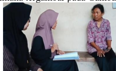
Gambar 1. Proses Pengumpulan Data

teknologi yang lebih tinggi serta semangat partisipasi yang kuat. Hal ini sejalan dengan temuan Iskandar (2025) yang menegaskan bahwa pemberdayaan remaja masjid melalui sistem informasi teknologi mampu mempercepat proses digitalisasi dan meningkatkan keterlibatan jamaah dalam kegiatan masjid (Iskandar et al., 2025). Selain itu, Amin & Muhammadah (2024) menyatakan bahwa keberhasilan pengelolaan masjid modern sangat ditentukan oleh kolaborasi antargenerasi terutama sinergi antara pengurus senior dan pemuda untuk menciptakan inovasi pengelolaan yang relevan dengan kebutuhan masyarakat masa kini (Amin & Muhammadah, 2024). Kegiatan tersebut sebagaimana tergambar pada Gambar 1.