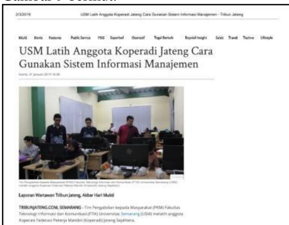
Gambar 7. Publikasi Media Masa Online Tribun Jateng

Sedangkan publikasi hasil Pengabdian kepada Masyarakat pada media masa online terdapat pada Gambar 7 sampai dengan Gambar 9 berikut.