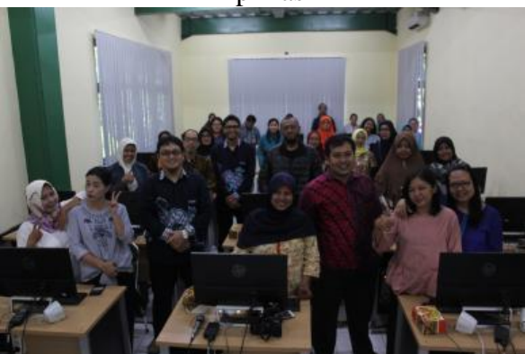
Gambar 6. Foto Bersama Peserta Setelah Kegiatan Pengabdian Dilakukan

Sedangkan publikasi hasil Pengabdian kepada Masyarakat pada media masa online terdapat pada Gambar 7 sampai dengan Gambar 9 berikut.