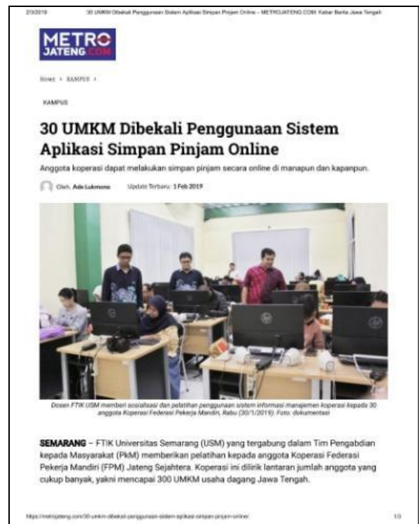
Gambar 8. Publikasi Media Masa Online Metro Jateng