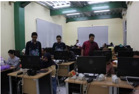
Gambar 5. Suasana Praktek Penggunaan Aplikasi