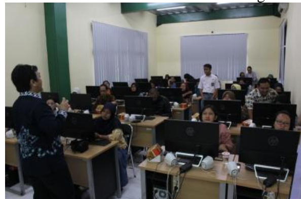
Gambar 4. Suasana Pemaparan Materi kepada Peserta

Bagi peserta, luaran yang dicapai yaitu peningkatan kemampuan dan ketrampilan peserta dalam menggunakan Sistem Informasi Manajemen Koperasi FPM Jawa Tengah. Hal tersebut dapat dilihat dari hasil evaluasi melalui kuesioner dan evaluasi dari mempraktekkan langsung penggunaan fitur setoran, setoran angsuran, penarikan, pengajuan kredit serta fitur lain yang terdapat pada sistem. Berikut dalam Gambar 4 sampai Gambar 6 adalah dokumentasi hasil kegiatan.