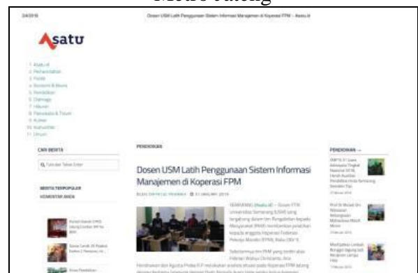
Gambar 9. Publikasi Media Masa Online Asatu