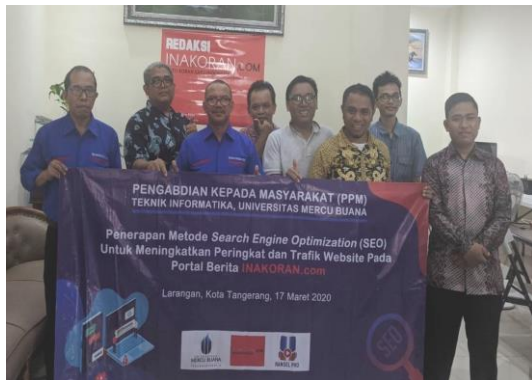
Gambar 3. Tim Bersama Para Redaktur

Selanjutnya tahap pendampingan yang berlangsung selama satu minggu sejak pelaksanaan pelatihan. Pada tahap ini tim pengabdian merespon setiap pertanyaan dari tim redaksi Inakoran.com khususnya dalam implementasi teknik SEO. Komunikasi pendampingan dilakukan melalui layanan pesan teks dan telepon Whatsapp bahkan video call untuk memberikan panduan langsung. Umumnya yang selalu ditanyakan pada tahap pendampingan ini terkait Post dengan pengaturan SEO.