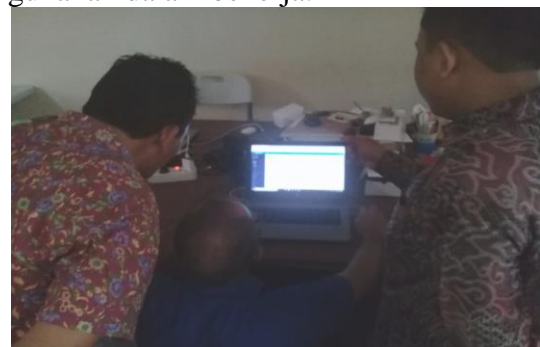
Gambar 2. Latihan Praktik Teknik SEO

Khusus install Yoast SEO, pihak pemateri menyiapkan beberapa website uji coba untuk praktik install , namun pada saat praktik post berita, semua peserta pelatihan menggunakan akun yang selama ini telah digunakan dalam bekerja.