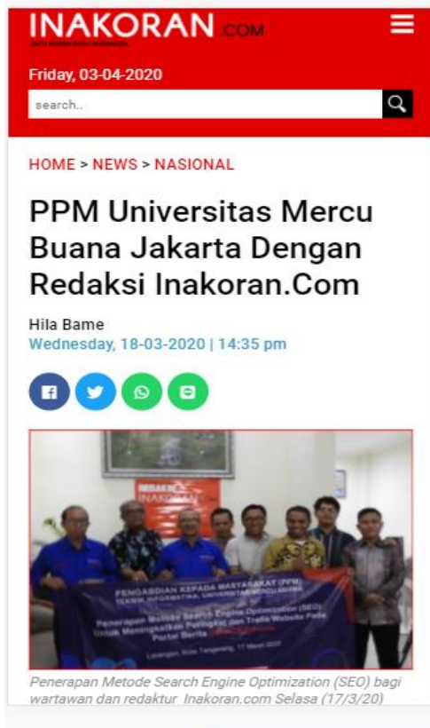
Gambar 4. Berita Pelatihan di Inakoran.com