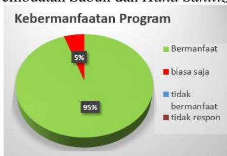
Gambar 5. Kebermanfaatan Kegiatan Pelatihan

Gambar 5 menunjukkan pelatihan pembuatan hadsanitaizer mendapatkan respon positif dari peserta pelatihan ada 95% peserta merasa kegiatan ini sangat bermanfaat untuk melindungi kesehatan keluarga dimasa pandemi covid 19 ini.