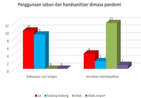
Gambar 6. Penggunaan Sabun dan Handsanitizer di Masa Pandemi Covid 19

hidup sehat dan higienis sehingga masyarakat dapat membiasakan hidup sehat (Cure & Van Enk, 2015).