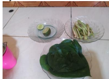
Gambar 3. Pemanfaatan Tanaman Herbal sebagai Antiseptic

Penyuluhan dilakukan agar masyarakat memiliki pemahaman tentang kandungan dalam daun sirih, sereh, jeruk dan tanaman herbal lainnya. Sehingga dapat mengetahui potensi pengembangan daun sirih sebagai produk bernilai guna tinggi. Selain itu, penyuluhan juga memberikan pemahaman tentang manfaat penggunaan sabun antiseptik dan hand sanitizer dan dapat meningkatkan kesadaran masyarakat dalam menerapkan pola hidup bersih dan sehat. Dengan demikian masyarakat dapat memberikan kontribusi dalam memutus rantai penyebaran COVID-19.