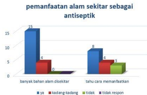
Gambar 7. Pemanfaatan Lahan Sekitar sebagai Bahan Antiseptik

Mahal dan langkanya handsanitaizer membuat warga enggan untuk membelinya. Dengan memanfaatkan tanaman herbal disekitar seperti sirih, serih dan jeruk nipis (Sarwono, 2001) kita dapat membuat handsanitaizer dan ada 79% warga yang memiliki bahan alam ini, dan 42 persen tahu cara pemanfaatannya ditunjukkan pada Gambar 7.