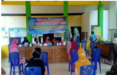
Gambar 2. Pengarahan Pola Hidup Sehat dan Bersih

Masyarakat diajak untuk berpola hidup bersih dan sehat. Pola hidup bersih dan sehat meliputi konsumsi makanan sehat, sering mencuci tangan, jaga jarak dan memakai handsanitizer. Selain itu juga diberikan wawasan tentang pemanfaatan lahan pekarangan. Warga antusias pada kegiatan ini dan diterapkan protap covid dalam kegiatan ini ditunjukkan Gambar 2.