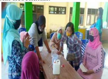
Gambar 4. Pendampingan Pelatihan Pembuatan Sabun dan Hand Sanitizer

Paska pelatihan dilakukan pendampingan langsung pembuatan sabun antiseptik dan hand sanitizer yang dilakukan oleh mitra sasaran sesuai dengan prosedur yang disampaikan pada kegiatan pelatihan. Selain itu juga dilakukan evaluasi sebagai kontrol terhadap kualitas produk yang dihasilkan, dimana agar komposisi bahan dan proses pembuatan sesuai dengan standar ilmiah dan kesehatan.