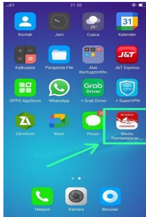
Gambar 3. Tampilan Aplikasi yang sudah di- instal

selanjutnya yaitu ahli materi yang bertujuan untuk mengukur kualitas dan kevalidan aplikasi media pembelajaran sejarah Indonesia berbasis android .