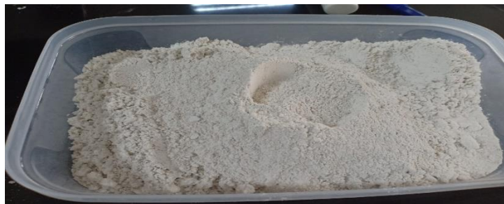
Gambar 1. Tepung pati ubi jalar

Hasil pembuatan pati ubi jalar, dari 3 kg ubi jalar putih, menghasilkan pati sebanyak 453,82 gram dengan rendemen pati ubi jalar sebesar 15,13%. Kadar glukosa tertinggi sebesar 62,76% diperoleh pada waktu hidrolisis 30 menit, sedangkan pada waktu hidrolisis 45 menit dan 60 menit menghasilkan kadar glukosa masing-masing sebesar 58,88% dan 50,23%.