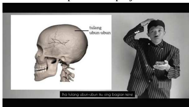
Gambar 7. Bagian Inti Cerita Film Pendek

b. Bagian isi meliputi inti cerita film pendek dan penjelasan materi.