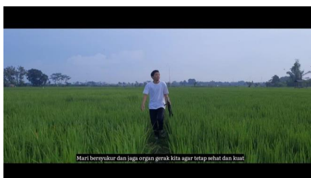
Gambar 8. Kesimpulan Cerita Film Pendek

c. Bagian penutupi meliputi kesimpulan cerita film pendek.