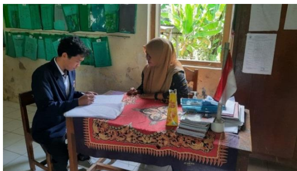
Gambar 2. Wawancara Guru Kelas V