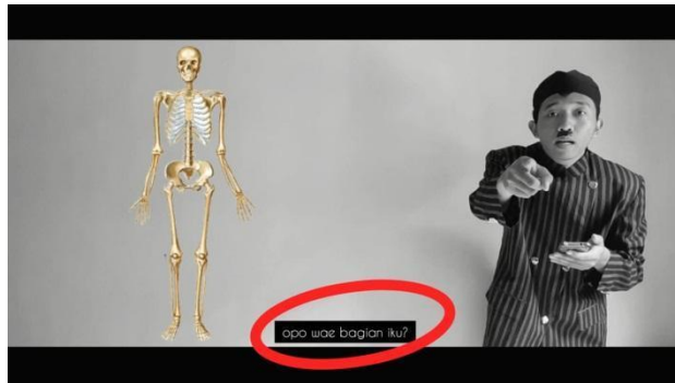
Gambar 4. Sebelum Revisi (mengganti subtitle )

Untuk evaluasi/revisi pada tahap design yaitu mengubah bahasa voice over pada bagian inti penjelasan materi yang sebelumnya menggunakan Bahasa Jawa diganti menggunakan Bahasa Indonesia dan subtitle -nya yang sebelumnya menggunakan Bahasa Indonesia diganti dengan menggunakan Bahasa Jawa, dijelaskan pada gambar 4 dan gambar 5.