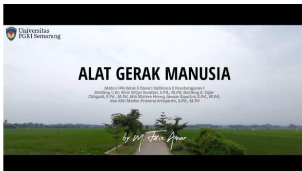
Gambar 6. Bagian Pembuka Film Pendek

Bagian awal meliputi pembuka berupa judul film dan cerita awal film