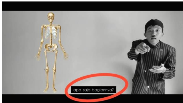
Gambar 5. Setelah Direvisi

Bagian awal meliputi pembuka berupa judul film dan cerita awal film