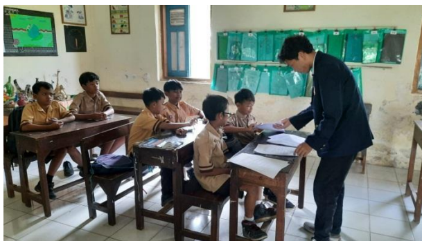
Gambar 3. Wawancara Siswa Kelas V

Pada gambar 2 dan gambar 3 merupakan kegiatan studi pendahuluan yang dilakukan melalui wawancara disertai angket kebutuhan dengan guru dan siswa kelas V di SD Negeri Karangwage 01, Kecamatan Trangkil, Kabupaten Pati. Berdasarkan wawancara dengan guru diperoleh informasi bahwa permasalahan yang ada adalah kurangnya penggunaan media pembelajaran berbasis teknologi, keterbatasan ketrampilan guru dalam teknologi dan kurang antusias dalam pembelajaran. Kurangnya penggunaan media pembelajaran berbasis teknologi disebabkan karena terbatasnya kemampuan guru dalam menggunakan teknologi sebagai media pembelajaran. Guru juga masih kesulitan dalam mengoperasikan aplikasi editan dalam mengembangkan media. Sehingga sampai saat ini guru belum menciptakan media berbasis teknologi. Dalam proses pembelajaran di kelas, guru masih sering menggunakan metode yang konvensional seperti ceramah, tanya jawab dan penugasan. Guru masih terpacu dengan buku-buku yang ada di sekolah. Media tematik yang ada di sekolah juga belum ada. Penggunaan media yang kurang menarik membuat siswa kurang antusias dan mudah bosan ketika pembelajaran di kelas. Banyaknya tugas guru di sekolah juga menjadi kendala karena jarang memiliki waktu luang untuk membuat media.